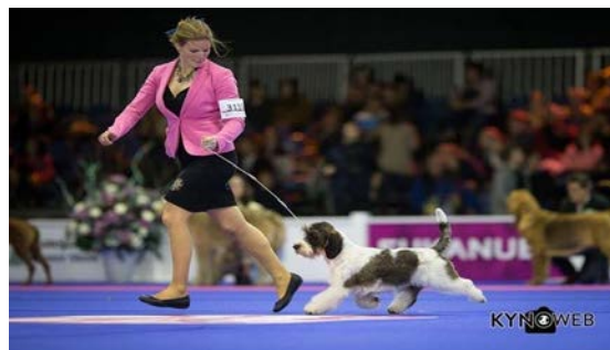
Animali da compagnia