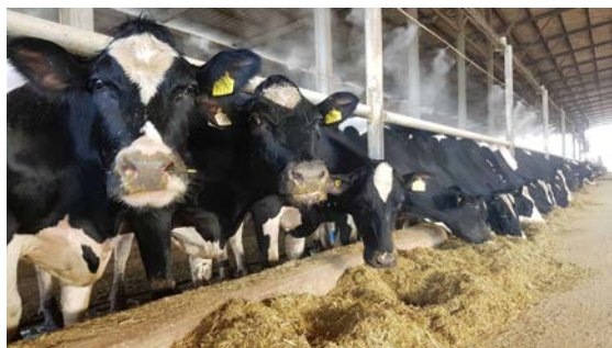
Animali da reddito

La scelta riguarda tre PERCORSI PROFESSIONALIZZANTI di esami: