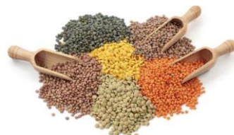
Materie prime per uso alimentare