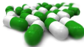
Principi Attivi Farmaceutici

Più di 4.000 articoli disponibili in più di 16.000 tagli standard o personalizzati su richiesta.