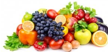
Vitamine e Minerali