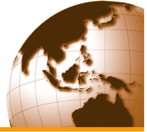
Figura 6-6: il commercio internazionale in assenza di rendimenti crescenti