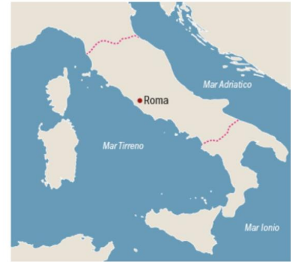
L'area della penisola controllata da Roma nel 290 a.C.

298–290 Terza guerra sannitica (battaglia delle nazioni e sconfitta dei Sanniti).