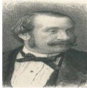
Pasquale Stanislao Mancini