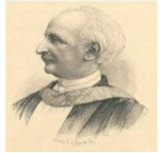
Tobias M.C. Asser