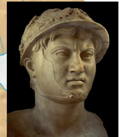
Pirro, re dell'Epiro