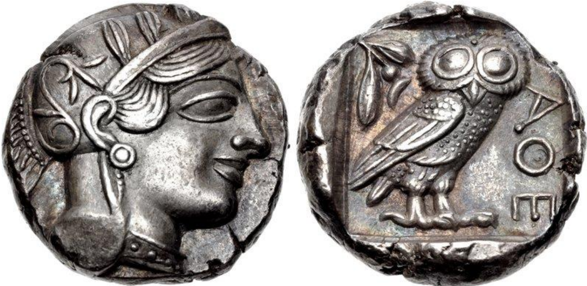
Tetradramma di Atene (ca. 454-404 a.C.).