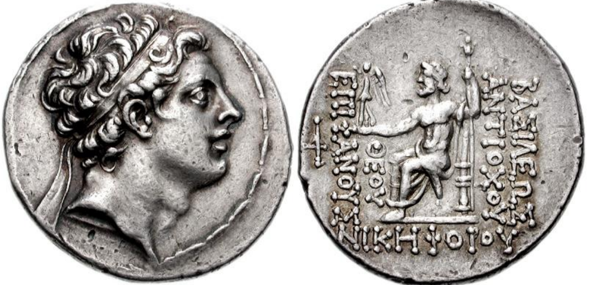
Tetradramma di Antioco IV (175-164 a.C.).