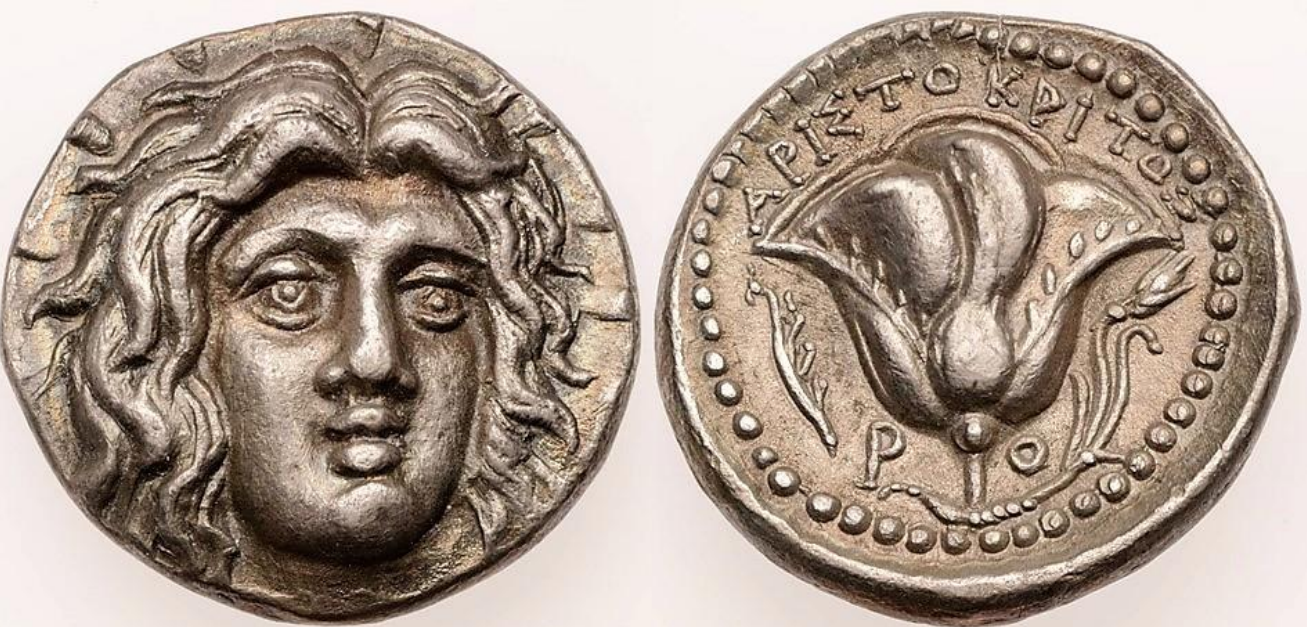
Rodi, didracma con nome del magistrato Aristokritos (seconda metà del III secolo a.C.)