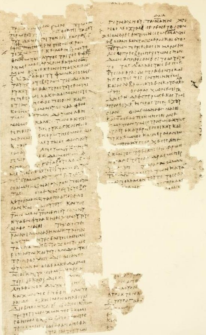
P. Oxy. 16 (I sec. d.C.) che riporta un passo di Tucidide, IV 36-41