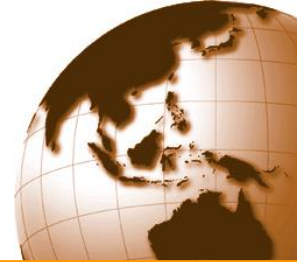
Figura 4-8: il commercio internazionale conduce alla convergenza dei prezzi relativi