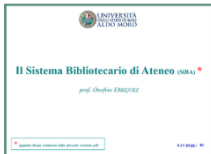
Onofrio Erriquez: Il Sistema Bibliotecario di Ateneo (SIBA)