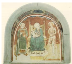
4. Madonna con Bambino tra santi (San Carlo)