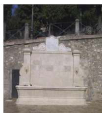
6. Fontana monumentale Piazza San Francesco