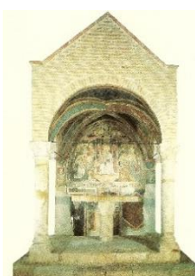
3. Madonna in trono con Bambino (San Carlo)