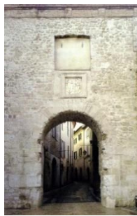
13. Porta Burgi Piazza San Francesco