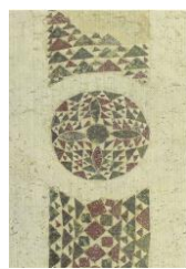
8. Facciata occid.part. San Giovanni B..