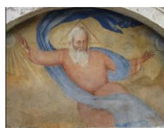
11. Lunetta con affresco Chiesa del Duomo