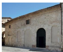
14. Facciata S.M. de Incertis (San Carlo)