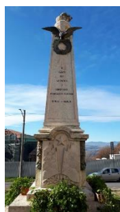
12. Monumento ai caduti