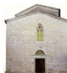
10. Facciata Chiesa del Duomo