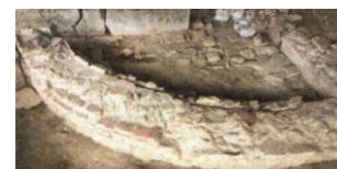
15. Struttura muraria B Terme di Carsulae

Si stanno altresì concludendo i lavori della facciata di San Francesco, compreso il dipinto murale posto nella nicchia