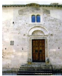
7. Portale cosmatesco San Giovanni Battista