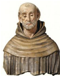
9. Busto San Bernardino Chiesa San Francesco