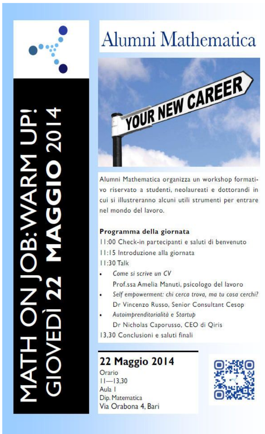
Figura 3.1: Workshop “Math on job: warm up” - Bari, 22/05/2014