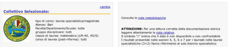
Tabella 2.2: Laurea II livello matematica Bari - Risposte dei laureati al questionario AlmaLaurea