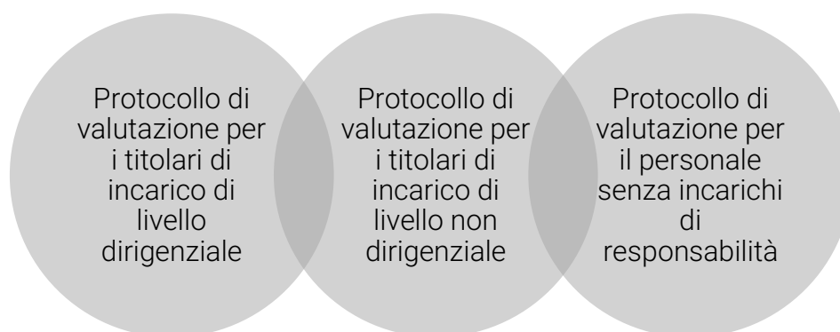
Figura 5 - Protocolli di valutazione performance individuale

Sono considerati soggetti con incarichi di responsabilità: