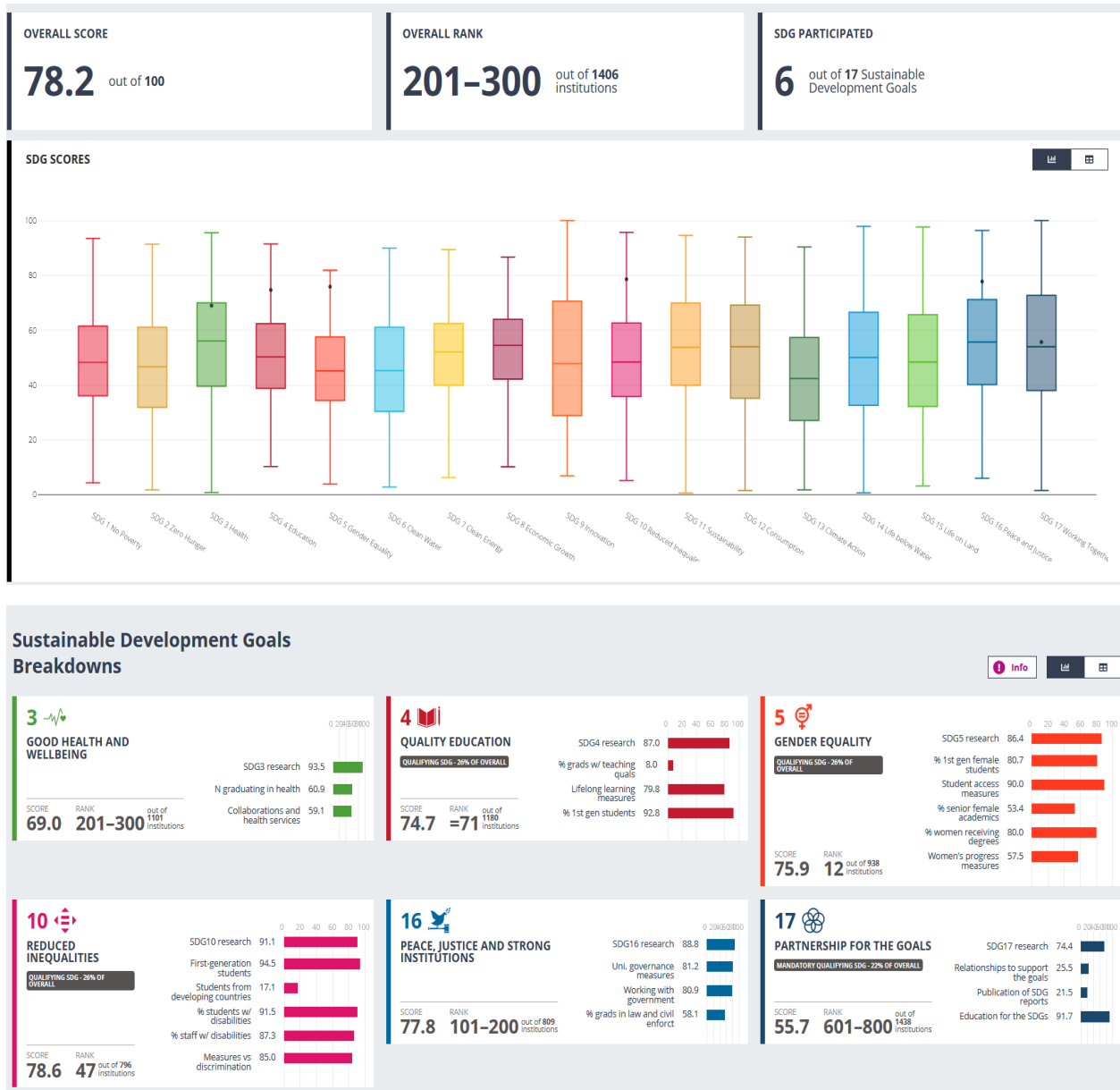
Figura 2 - Posizionamento dell'Università di Bari nei SDGs del Times Impact ranking 2022