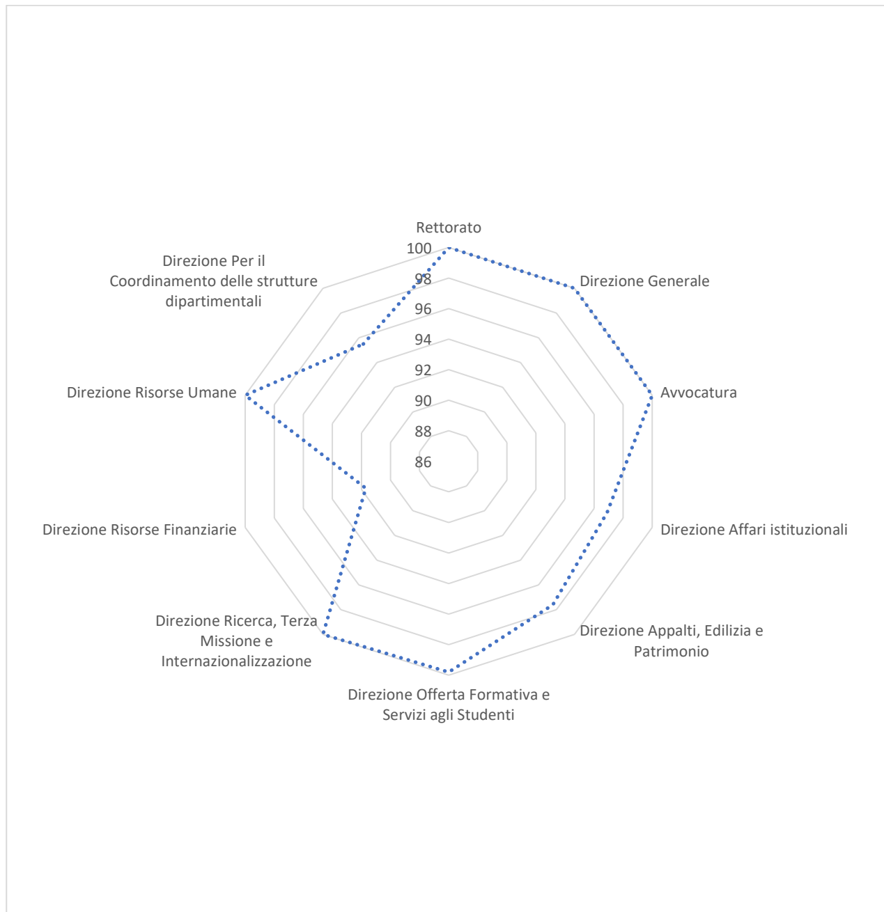
Figura 4 - Performance organizzativa delle strutture di livello 2 (Direzioni)

In linea con la metodologia descritta nel SMVP si è proceduto con il calcolo della performance organizzativa. La figura che segue riepiloga la performance organizzativa delle strutture di II livello organizzativo.