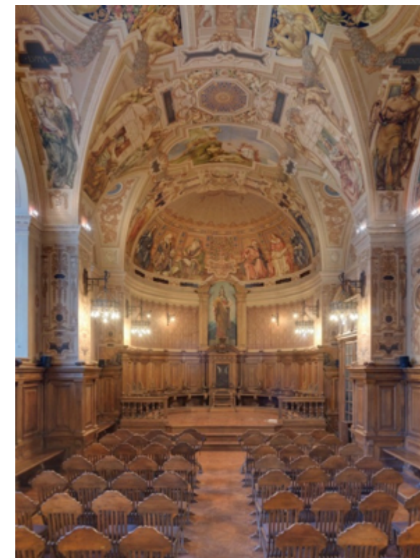
Aula Magna "Aldo Cossu"